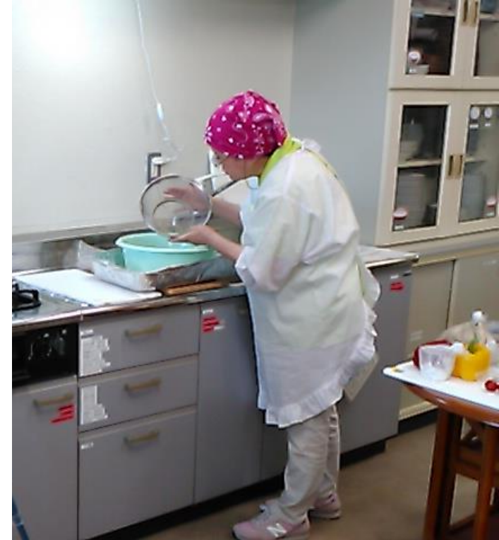
糠を篩ってごみを除く