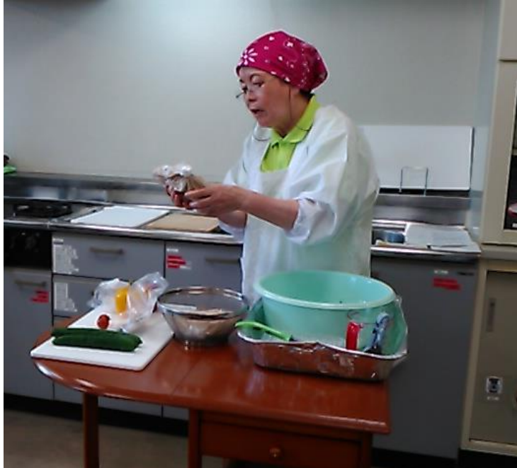
材料と器具の準備